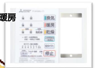
コントロールスイッチ P-141SW2-T